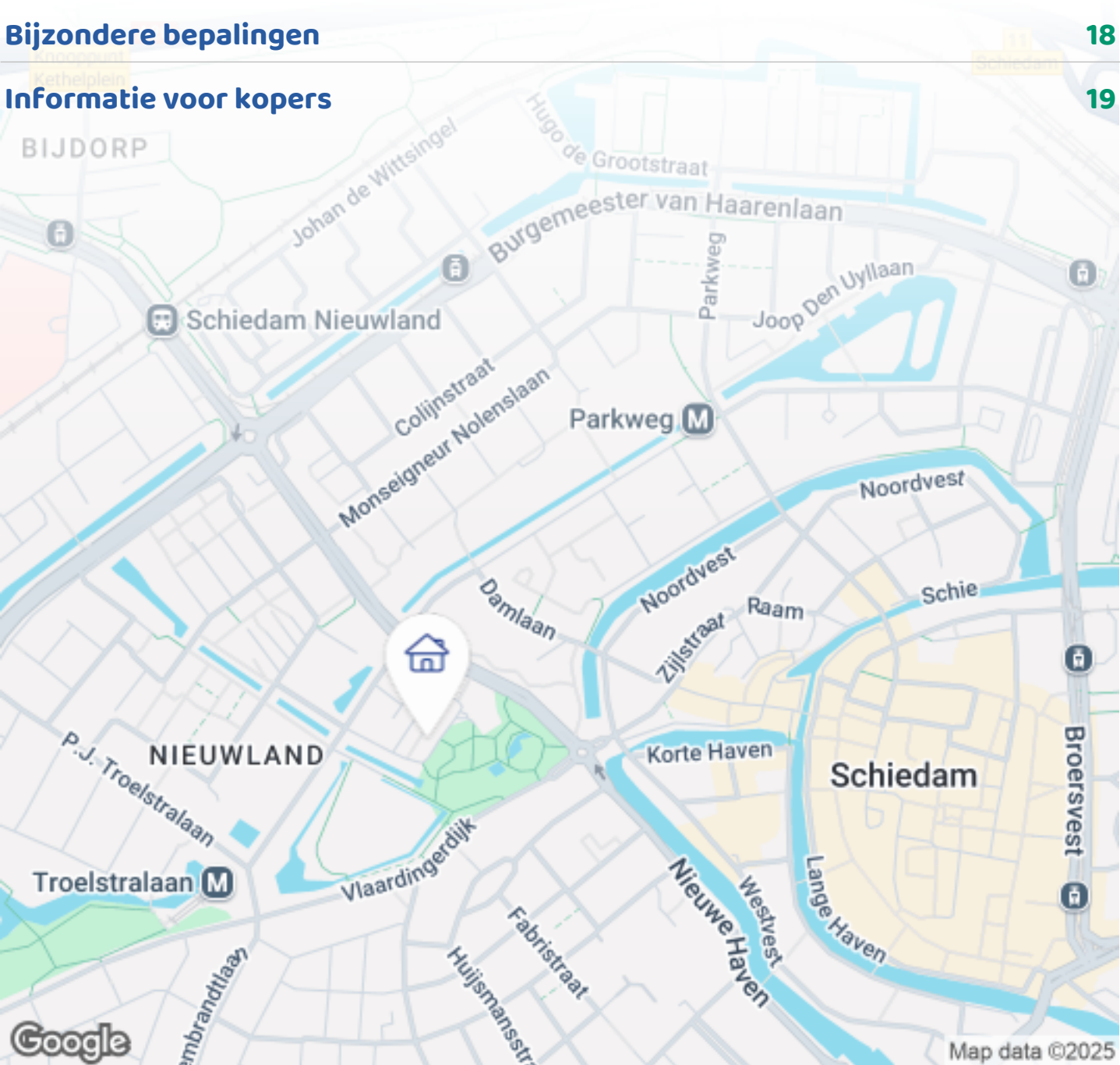
Woningbrochure: Burgemeester Stulemeijerlaan 81, Schiedam