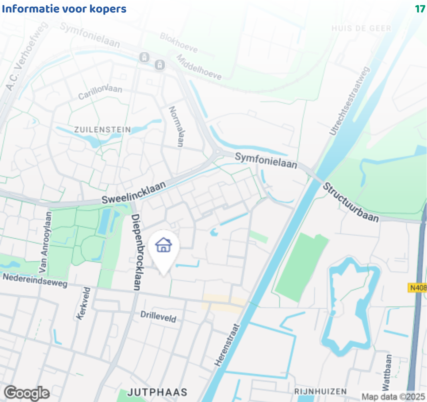
Woningbrochure: Nedereindseweg 30 31, Nieuwegein