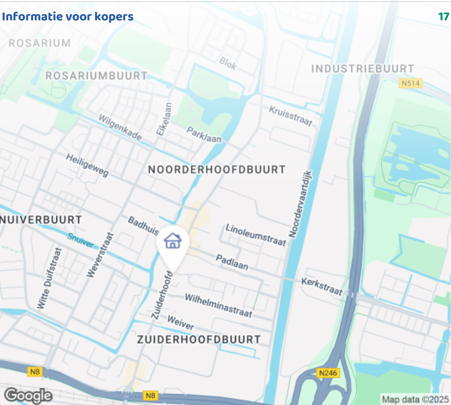
Woningbrochure: Zuiderhoofdstraat 42 B, Krommenie