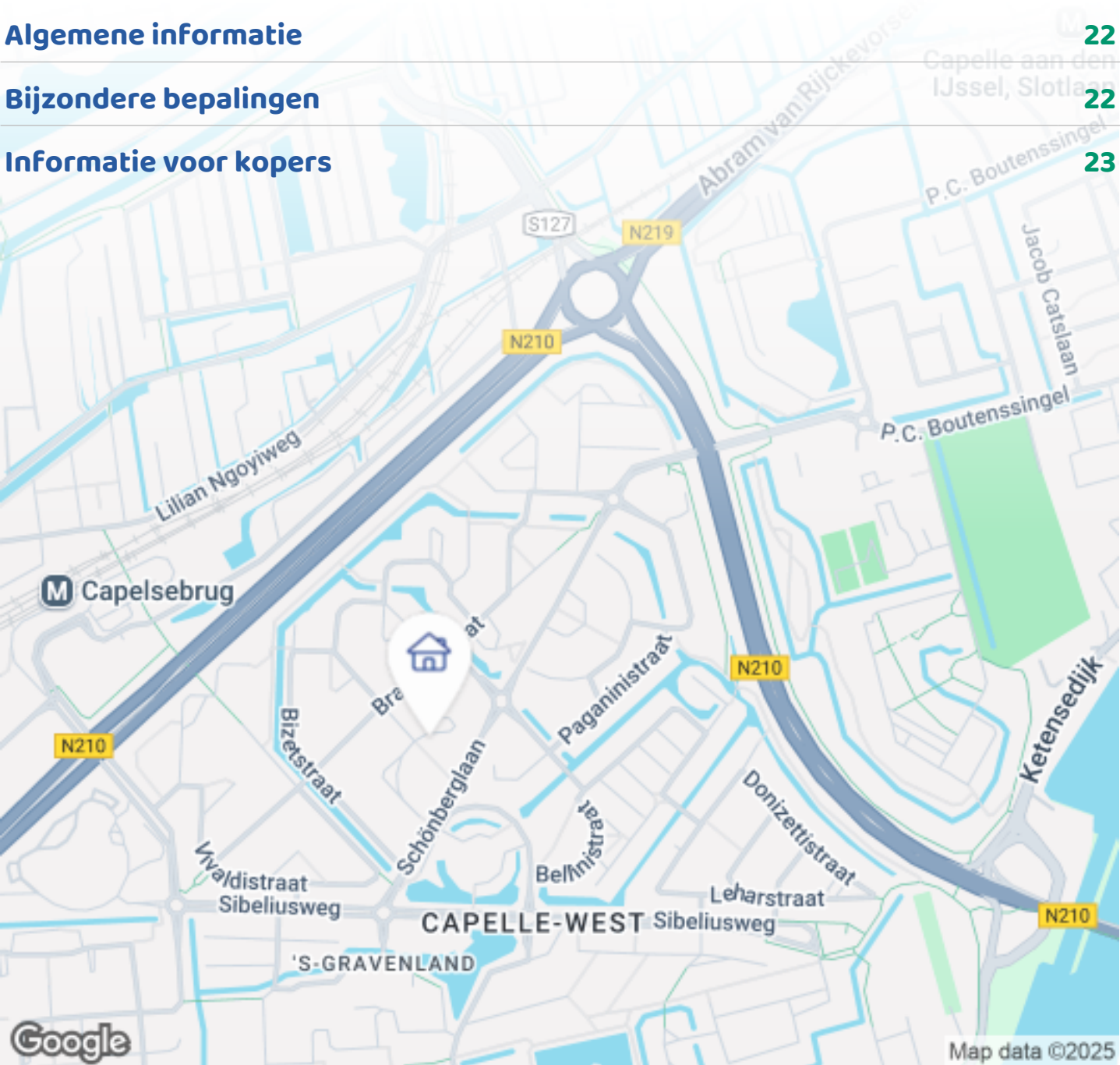
Woningbrochure: Mendelssohnstraat 28, Capelle aan den IJssel